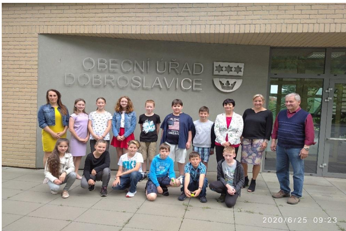
Loučení pátáků 2020