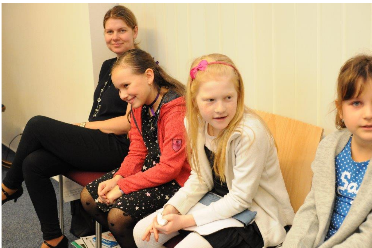
Vítání občánků 2020