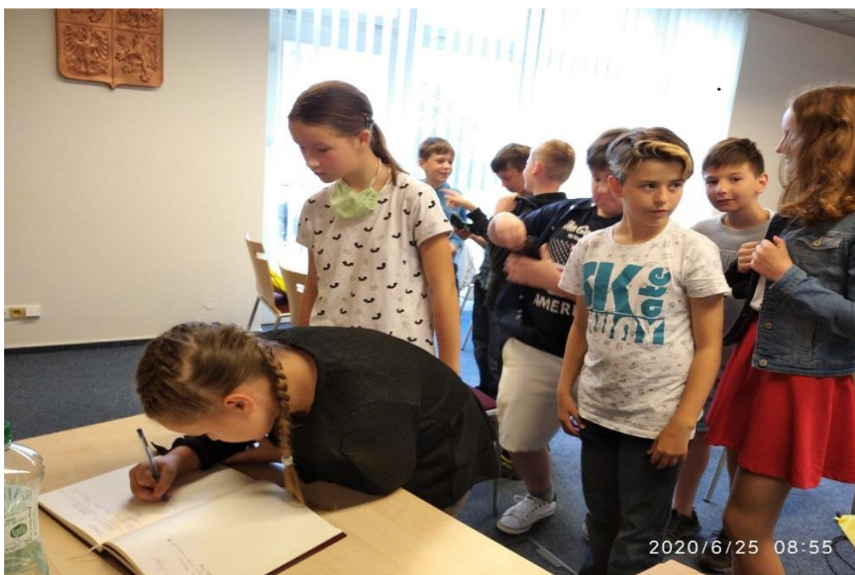
Loučení pátáků 2020