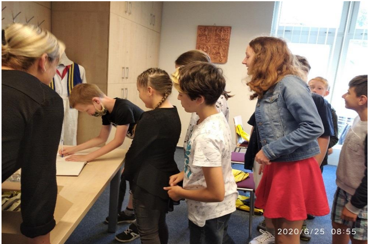
Loučení pátáků 2020