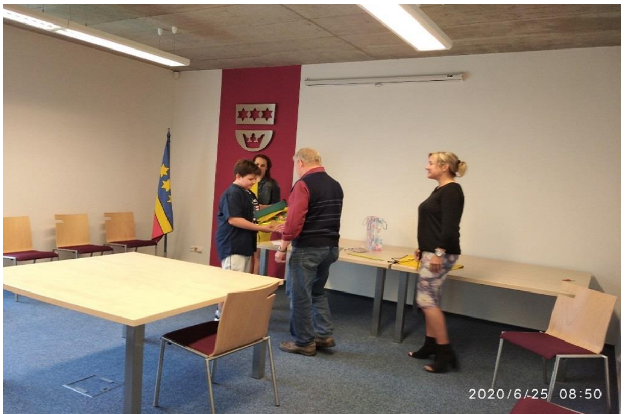
Loučení pátáků 2020