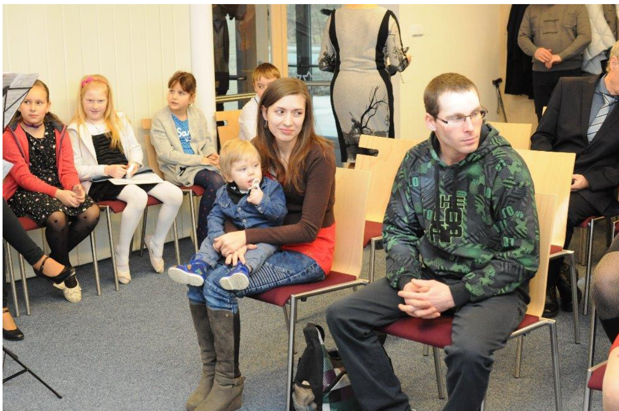
Vítání občánků 2020