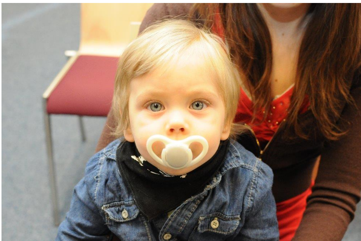
Vítání občánků 2020