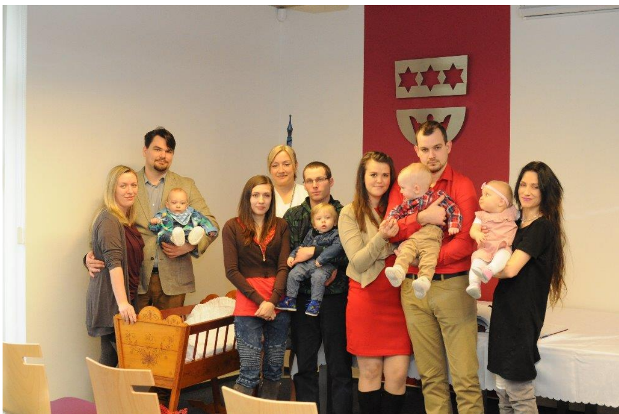
Vítání občánků 2020