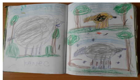
ukázka z turistických deníků dětí