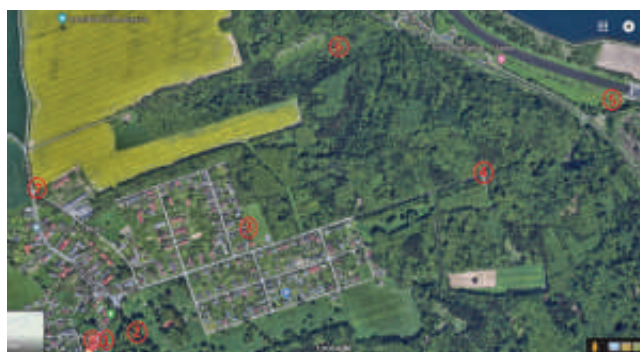
Mapa denní etapy 13.4.

r.osmancik@zachranny-tym.cz, +420 607 935 544