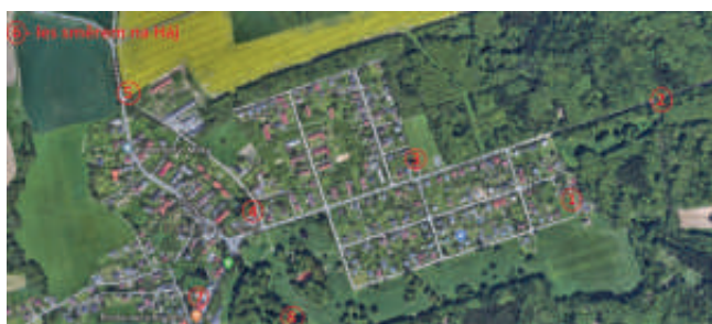
Mapa noční etapy 12.4.

V případě zájmu se účastnit, budeme rádi, když se nám ozvete na mail nebo telefon a domluvíme s Vámi další detaily.